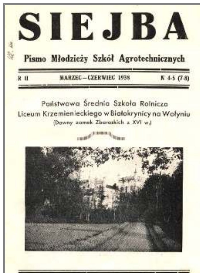
Siejba z 1938 r.