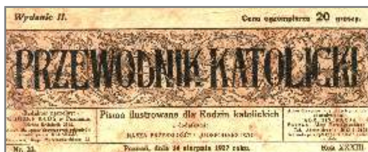
O wizycie w Pradze informował Przewodnik Katolicki z dn. 14 sierpnia 1927 roku.

W 1927 roku Towarzystwo Koleżeńskie Bojanowiaków zorganizowało wycieczkę do Czechosłowacji, której celem było zapoznanie się z tamtejszymi gospodarstwami rolnymi a także zwiedzenie wystawy rolniczej w Pradze.