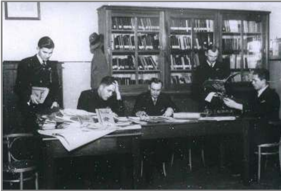
Redakcja Siejby - 1937 r.