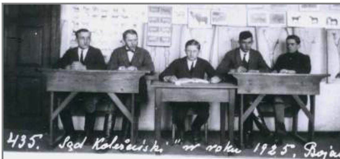
Sąd Koleżeński – 1925 r.

Wydział Bratniej Pomocy zajmował się udzielaniem pożyczek, zapomóg, pośrednictwem w organizowaniu praktyk i „posad”. Poza tym Wydział prowadził sklepik.