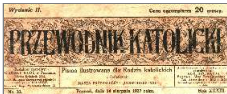
O wizycie w Pradze informował Przewodnik Katolicki z dn. 14 sierpnia 1927 roku.

W 1927 roku Towarzystwo Koleżeńskie Bojanowiaków zorganizowało wycieczkę do Czechosłowacji, której celem było zapoznanie się z tamtejszymi gospodarstwami rolnymi a także zwiedzenie wystawy rolniczej w Pradze.