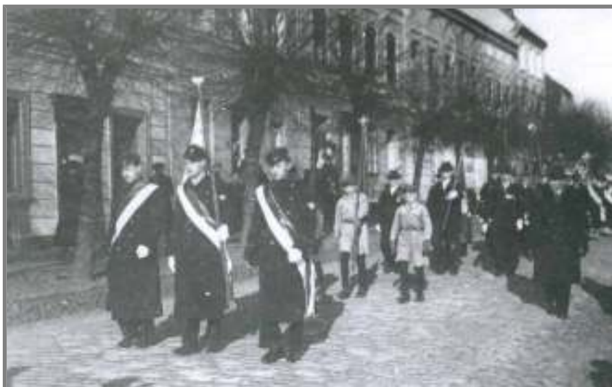
Poświęcenie sztandaru szkolnego

To właśnie na tę okoliczność w lutym 1937 r. TKB wydało swoje pismo, o nazwie „Siejba”, które odtąd prenumerowane było przez wszystkie szkoły rolnicze w kraju. 4